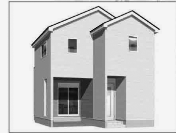
2号棟イメージパース