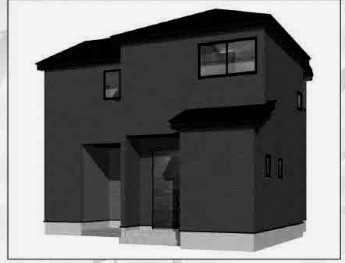
1号棟イメージパース

フラット35Sを使用する際、 別途適合証明取得費用が掛かります。 ※88,000円(税込)